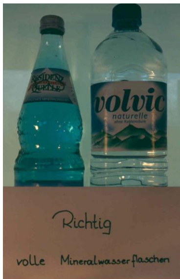
Abb. 3: Probengefäße „richtig“

In der Regel wird für die Durchführung einer chemischen Fischwasseranalyse mindestens 500 ml des Probenwassers benötigt. Bei einer zusätzlichen mikrobiologischen Untersuchung sollte die Wasserprobe 1.000 ml umfassen. Als Probengefäß eignen sich dicht verschließbare Glas- (z. B. Labor- oder Mineralwasserflaschen) oder gut gereinigte Mineralwasser-Plastikflaschen (Abb. 3). Auf keinen Fall dürfen Limo- oder Saftflaschen, Gurken- oder Marmeladengläser verwendet werden (Abb. 4). Es ist darauf zu achten, dass auch die Verschlüsse frei von anhaftenden Fremdstoffen sind.