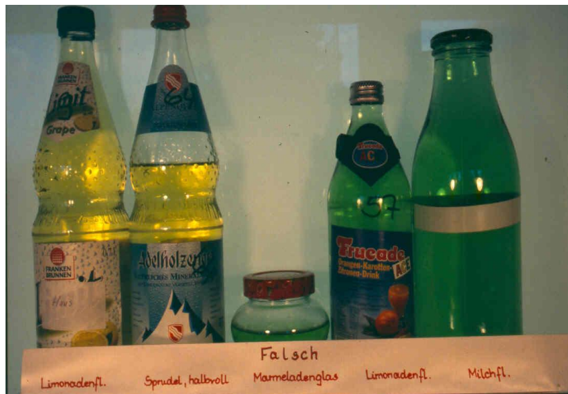
Abb. 4: „falsch“ genommene Wasserproben (-gefäße)

Soll auf Kohlenwasserstoffe wie Öl, Benzin, Lösungsmittel und Phenole, auf Detergenzien (z. B. Waschmittelzusätze) sowie auf Pestizide untersucht werden, so müssen die Proben immer in Glasgefäßen entnommen werden, da die genannten Substanzen von Plastik absorbiert werden können.