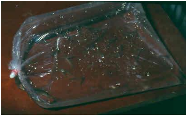
Abb.1: Versand im Plastiksack mit Sauerstofffüllung