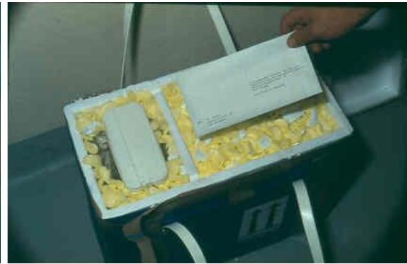
Abb. 2: Versand in Styroporbox mit Kühllakkus